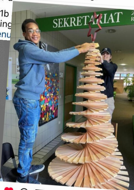
Gefällt sophia_albr und 48 weiteren Personen