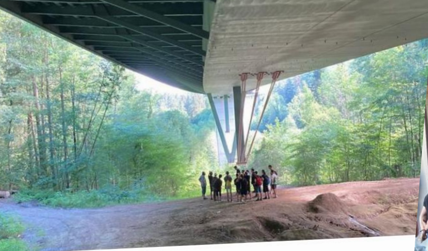
und 48 weiteren Personen