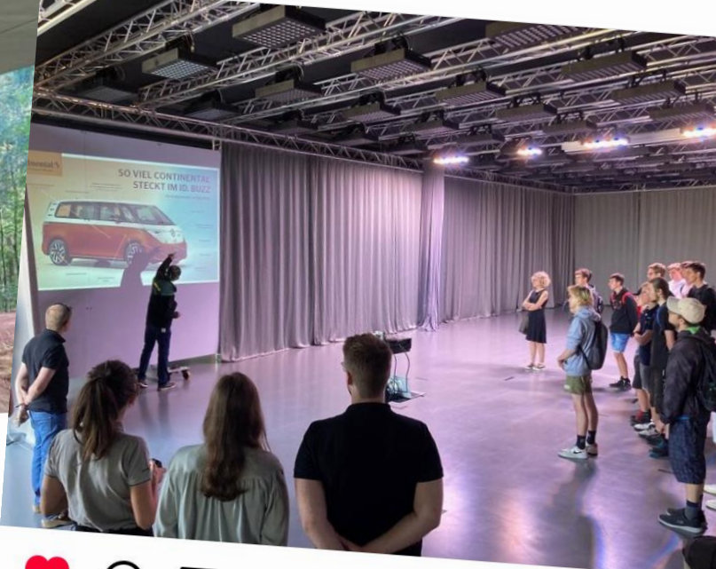
Gefällt sophia_albr und 48 weiteren Personen fos_lindau Exkursion T11b Continental nach Memmingen #elektro #messenrechnen