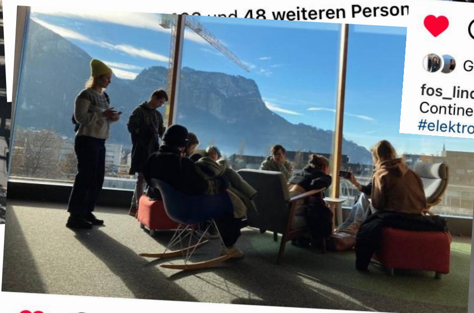
Gefällt sophia_albr und 23 weiteren Personen fos_lindau Besuch der G12a und G13a bei der FH in Dornbirn #kunst #fhdornbirn #gestaltung #studium #fos #zukunft